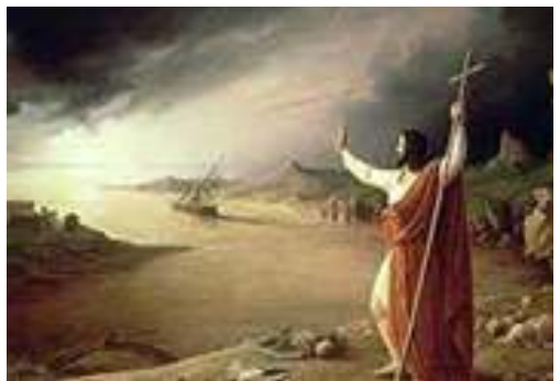
Sabrat će svoje izabranike s četiri vjetra