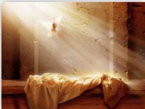
Jer Krist je uistinu uskrsnuo!